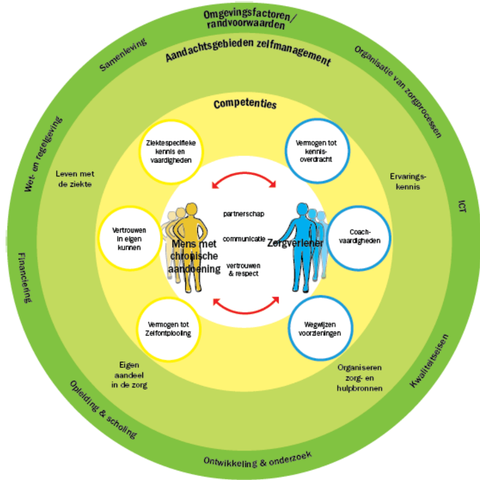
CBO Zelfmanagementmodel (2011)